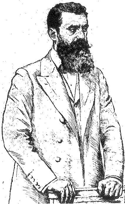
הרצל - איור של הרמן שטרק

קוראינו יודעים, כי אין אנו מחסידי הרצל. מאז הוציא לאור את מחברתו הרבינו להתנוכח עמו, וגם עתה עוד חזון למועד הוויכוחים, ונדמה כי הד"ר הרצל עצמו אינו מבקש להתרומם מעל למדת הבקורת, להחשב לאפיפיור נקי משגיאות, אך האמת תמריצנו להודיע, כי באיש הזה נפגשו מעלות ומדות רבות הראויות למנהל מפלגה. הד"ר הרצל, מלבד כשרונו הגדול בתור סופר אירופאי, הוא גם איש חמדות, בעל טעם ונימוס. קמתו הגבוהה והנאוות, עיניו השחורות, תארו היפה וכל שיחו ושיגו מפקים חן וענווה, אצילות הרוח ורוממות הנפש. בברק עיניו השחורות נראה הד"ר הרצל כבעל דמיון וחולם, אך הוא מתגבר על כל דמיונו ומתאמץ בכל יכולתו לבטל את רוח השירה והחזיון מפני תנאי החיים ומשאלות ההווה. נדמה כי במשך ירחים מספר מאז החלה הרוח לפעמו, כבר למד הרבה מפי הנסיון, ותקוותנו עזה כי עוד ילמד הרבה.